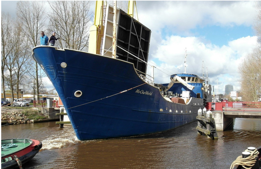
Antwerpenbrug: de Coaster die de Oosterhaven nooit zou bereiken.