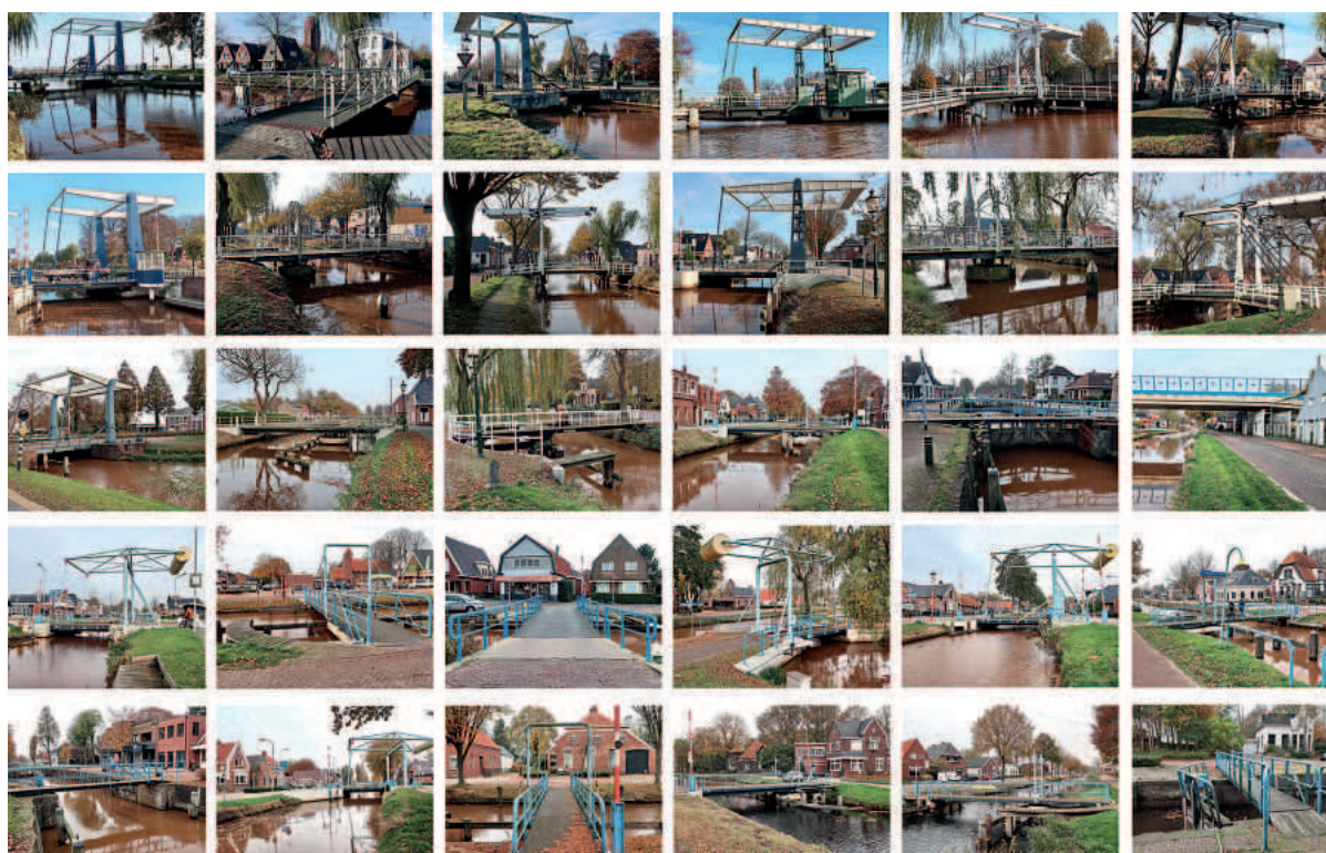
De bruggen van Pekela.