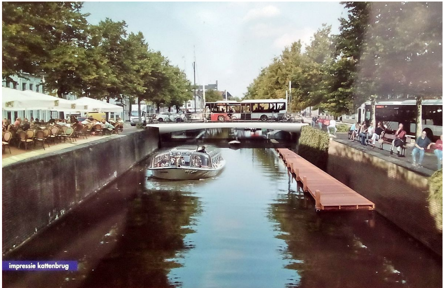
Impressie Kattenbrug op informatiepaneel