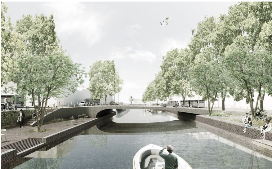
Update juni 2018: de meest recente (definitieve?) impressie van de vaste brug