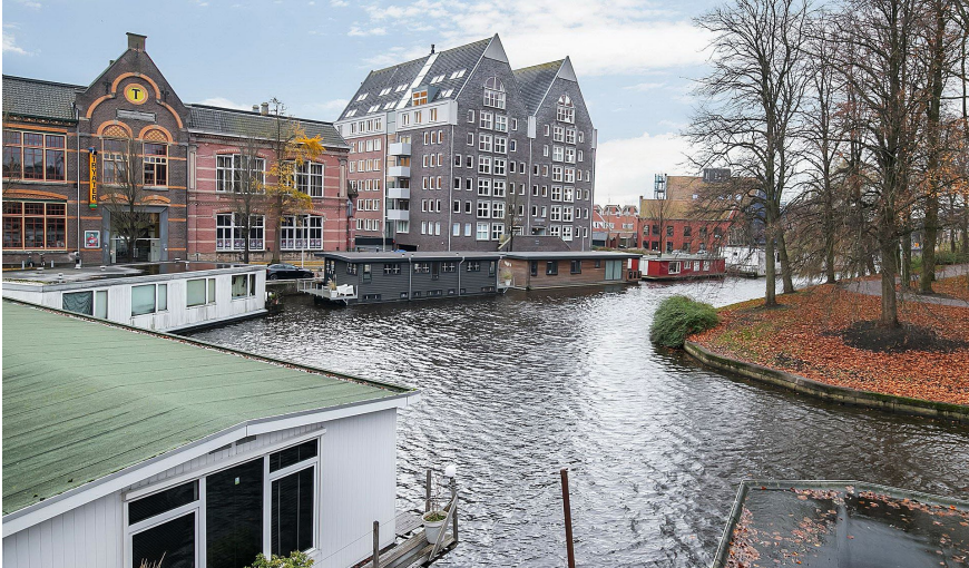
de woonarken aan de Oostersingel in Leeuwarden