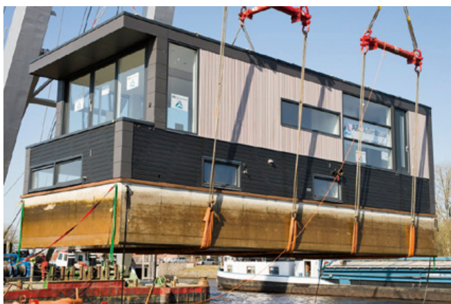
Nieuw drijvend bouwwerk, zoals een nieuwe woonboot.