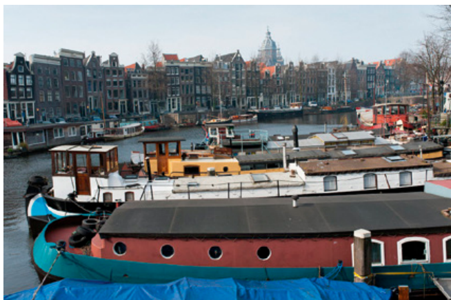
Bestaande drijvende objecten die door functiewijziging een nieuw drijvend bouwwerk worden.

Als de Wet verduidelijking voorschriften woonboten in werking is getreden, zijn er twee soorten “nieuwe drijvende bouwwerken”. De eerste soort zijn drijvende bouwwerken die nieuw worden gebouwd, zoals nieuwe woonboten en watervilla's. De tweede soort zijn bestaande drijvende objecten die door functiewijziging een nieuw drijvend bouwwerk worden, bijvoorbeeld een vrachtschip dat voortaan als woonboot wordt gebruikt. De eigenaren van een nieuw drijvend bouwwerk moeten een omgevingsvergunning aanvragen als zij met dat bouwwerk ergens willen gaan liggen. De gemeente toetst de aanvraag aan onder meer het Bouwbesluit 2012 en het bestemmingsplan.