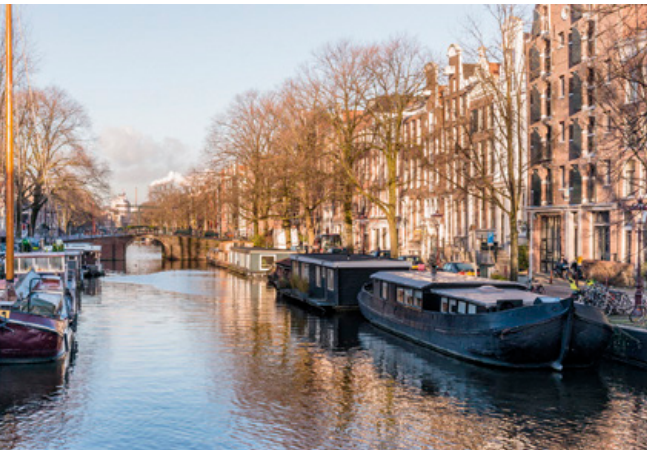
Bestaande ligplaatsen (binnenstedelijk).

https://www.rijksoverheid.nl/documenten/publicaties/2015/07/01/een-dek-is-geen-dak