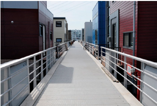
Voorbeeld veilige steiger bij nieuwe ligplaats.

De steiger tussen het drijvende bouwwerk en de wal mag men aanmerken als aansluitend terrein. Hierdoor is het mogelijk een vluchtroute te laten uitkomen op een steiger. Zonder deze mogelijkheid zou een vluchtroute bij een drijvend bouwwerk moeten uitkomen op de wal. Vooral bij vervanging van woonboten op bestaande ligplaatsen zou dit tot praktische problemen kunnen leiden. Een gemeente kan bij nieuwe ligplaatsen en waterkavels de posities van de drijvende bouwwerken ten opzichte van elkaar en de afmetingen van de steiger in het bestemmingsplan zodanig vastleggen dat er veilig over de steiger kan worden gevlucht bij brand.