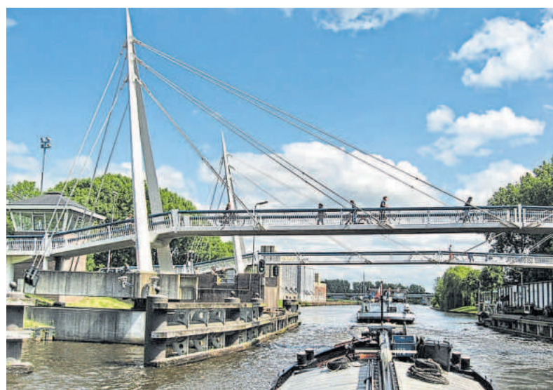
Zicht op de Gerrit Krolbrug in huidige staat, vanaf het water.

Als de recreatieve wachtvoorziening van de Oostersluis aangebracht wordt voor de Gerrit Krolbrug, dan wachten de recreatieschepen daar om vervolgens achter de eerstvolgende beroepsvaart aan te sluiten en verder naar de Oostersluis te varen. Dat is nog veel veiliger ook omdat de situatie direct voor de sluis nu vaak