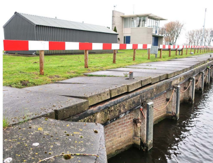
waarschuwing voor struikelgevaar