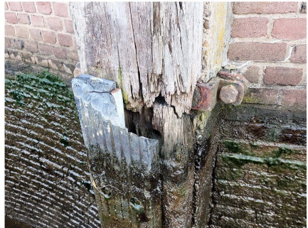
tijdens het schutten

Op onderstaande foto is een aantal gebreken te zien. Een scheur in de sluiswand, opwippende betonnen platen, een te diep liggende bolder links achter het paaltje en een technische installatie die is afgedekt met een plastic zak.