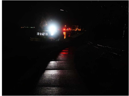
informatiepaneel, verblindend voor het fietspad