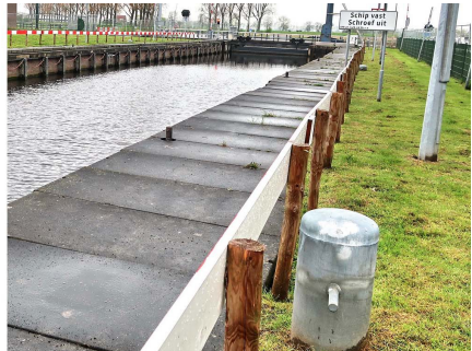
bolders voor vrachtschepen

Tijdens het schutten valt op hoe slecht de houten balken in de sluis er aan toe zijn. De kunststof bescherming is her en der verdwenen, gescheurd of afgebroken.