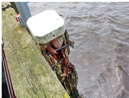
remmingwerk met meldknop

Eenmaal in de sluis springen de schots en schief liggende betonnen dekplaten in het oog die nog geen tien jaar geleden zijn aangebracht als een soort noodreparatie. Met meerdere borden wordt gewaarschuwd deze looppaden niet te betreden wegens struikelgevaar.