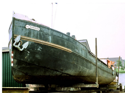
Gudrun in Ezumazijl, Friesland juni 1989