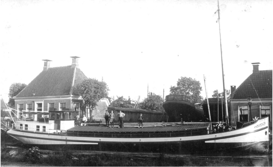
Scheepswerf H. Kroese te Hoogezand ca. 1925 (met een ander schip)