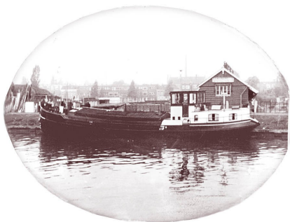
Gudrun in de jaren '60