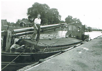
Frisia in de jaren '50

De onderstaande foto toont de Frisia nog in de oorspronkelijke staat die wellicht niet sterk afwijkt van de situatie tijdens de tewaterlating.