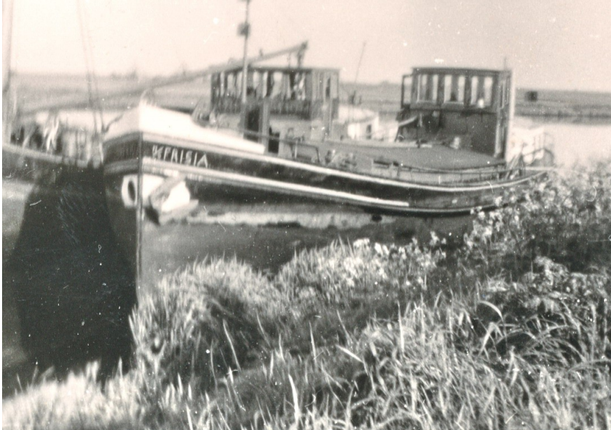
Motorschip Frisia begin jaren '50 (fam. Horjus)

Op 6 september 2023 was het precies 100 jaar geleden dat motorschip Gudrun als "Frisia" te water is gelaten in het tegenwoordig gedempte Winschoterdiep op de bescheiden scheepswerf van H. Kroese in het centrum van Hoogezand ( locatie ).