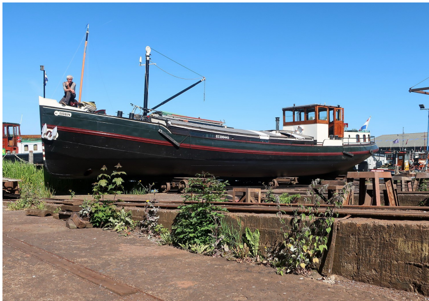
Tewaterlating juni 2023, scheepswerf Leemburg, Terherne

Van Driel heeft het schip zeer grondig gerestaureerd, een andere motor geïnstalleerd (Scania D8, 148pk), aluminium scheepsluiken gemonteerd, een kleine laadmast geplaatst en de vier grote roeframen vervangen door zes kleinere.