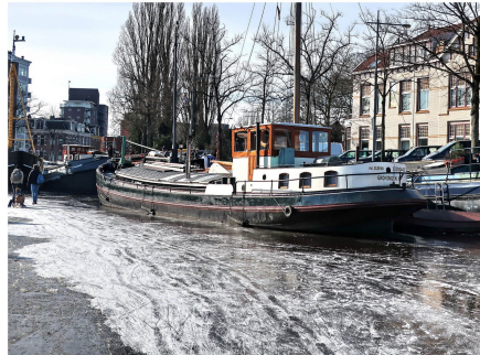
ms Gudrun 1989 - heden